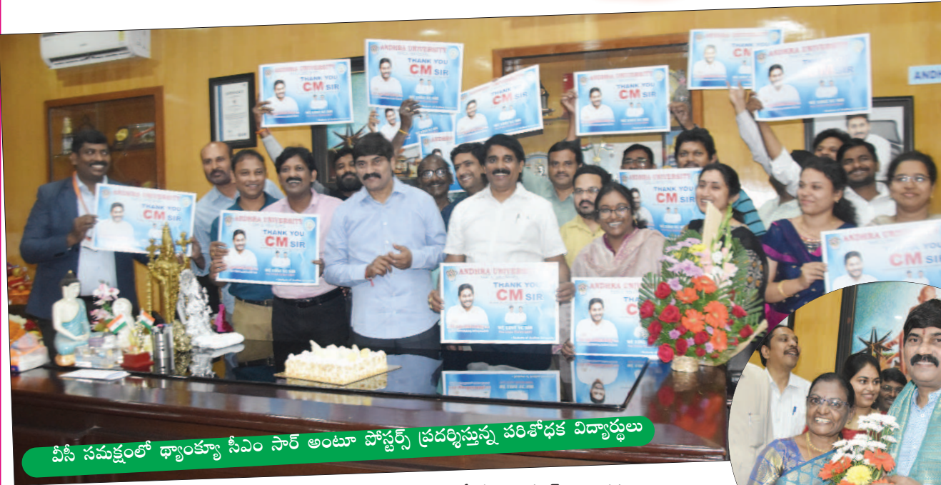
వీసీ సమక్షంలో ధ్యాంక్యూ సీఎం సార్ అంటూ పోస్టర్స్ ప్రదర్శిస్తున్న పరిశోధక విద్యార్థులు