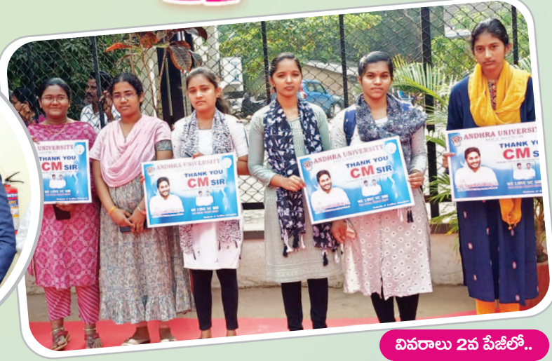
వివరాలు 2వ పేజీలో..